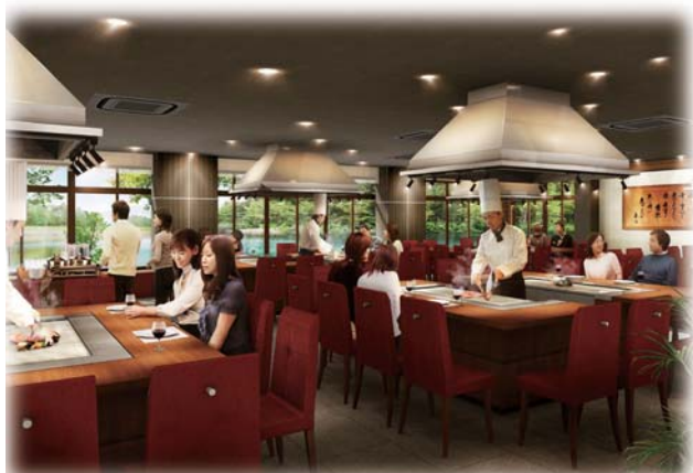
2013年6月にオープンした鉄板ダイニング「天満」

昭和 39 年 4 月 21 日 株式会社ウォーランド設立 (資本金 500 万円) 昭和 56 年 2 月 5 日 商号を株式会社レスト関ヶ原に変更 昭和 59 年 1 月 11 日 関ヶ原観光物産株式会社設立 (資本金 500 万円) 平成 4 年 9 月 30 日 株式会社レスト関ヶ原 資本金 1000 万円に増資 平成 5 年 2 月 28 日 関ヶ原観光物産株式会社 資本金 1000 万円に増資 平成 17 年 10 月 20 日 伊吹よもぎ屋オープン 平成 22 年 関ヶ原観光株式会社 グループ入り 平成 25 年 6 月 店名を麗守都関ヶ原より sekigahara 花伊吹として リニューアルオープン 平成 25 年 11 月 関ヶ原観光物産株式会社を吸収合併する